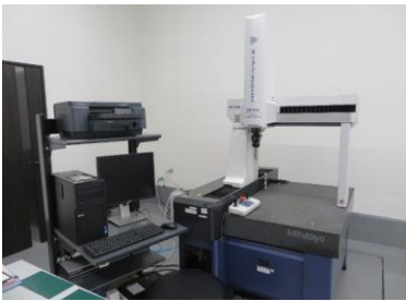
【三次元測定機 CRYSTA-Apex S574】 測定範囲：X 500mm / Y 700mm / Z 400mm

＜幾何公差・表面粗さ・硬度・膜厚など、あらゆる図面要求に対応できる各種測定機器を揃えております＞