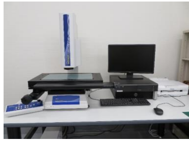
【マニュアル画像測定器 QS-L4020Z/AFB】 測定範囲：X 400mm / Y 200mm / Z 150mm