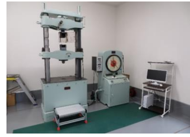
【アムスラー型 万能試験機】 最大測定範囲：500kN